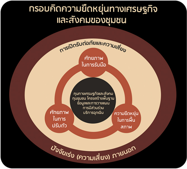
ที่มา: Parsons M, Morley P, et al (2016)